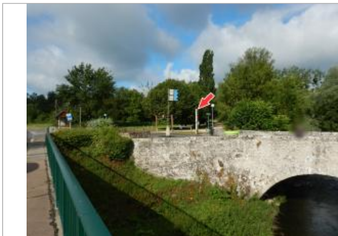
Vue du site depuis le pont de la D751