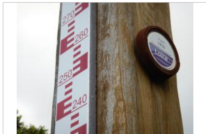
Vue du repère avec l'échelle