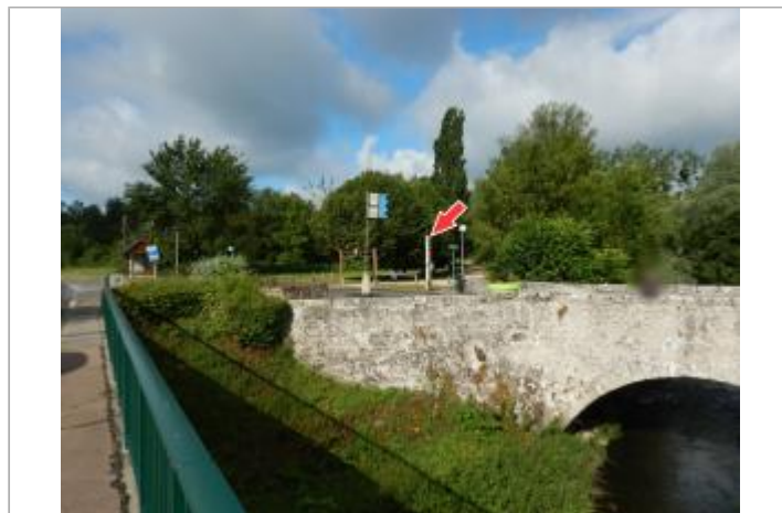
Vue du site depuis le pont de la D751

GÉOLOCALISATION Coordonnées WGS84 : X: 1.25994500 / Y: 47.49391000 Coordonnées RGF93 (Lambert 93) X: 568998.91 / Y: 6711837.58 Coordonnées RGF93 (ETRS89) : X: 1.259945 / Y: 47.49391 Code Hydro: K4-0220 Rive de référence: Gauche