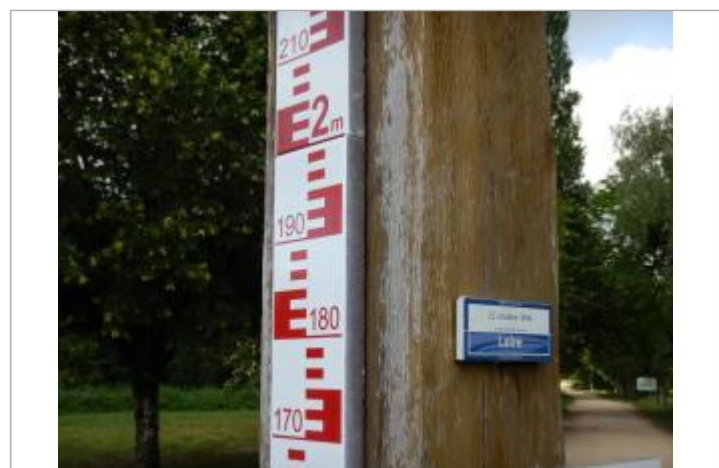
Vue du repère avec l'échelle

MARQUE Texte : Repère de crue - 22 octobre 1846 - Niveau atteint par les eaux - Loire - Établissement Public Loire Maximum de l'inondation : Oui Visibilité : Oui État du repère : Bon Pérennité : Longue