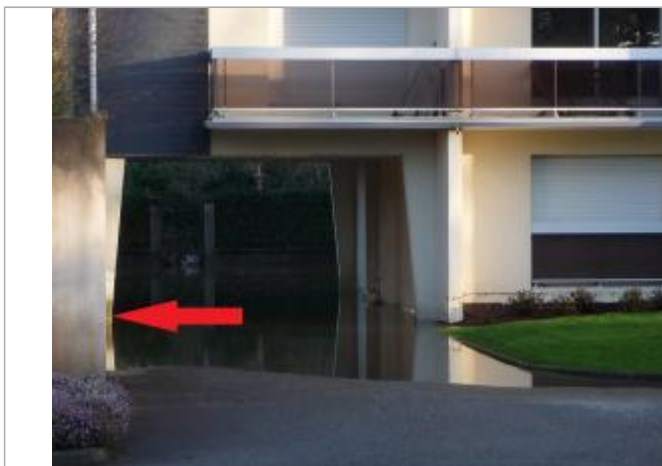
Sol de la voirie du parking - limite de la zone inondable

Altitude calculée de l'eau (en m) : 5.19 m