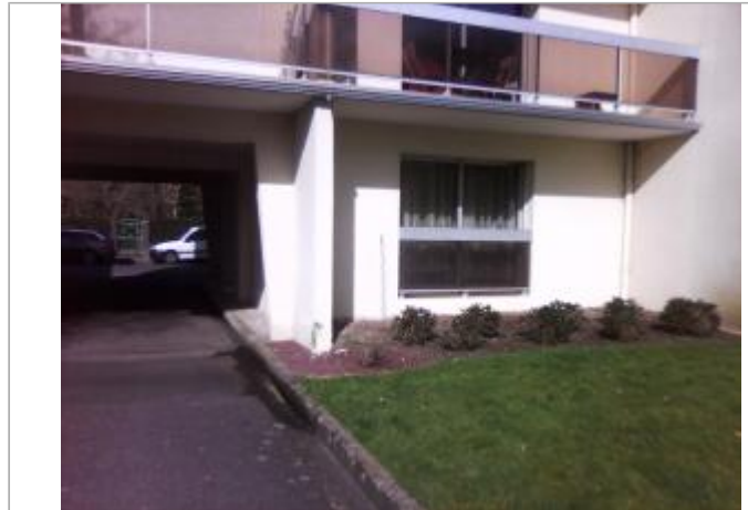
Vue d'ensemble de la façade du bâtiment d'habitation

Coordonnées WGS84 : X: -4.10997860 / Y: 48.00183150