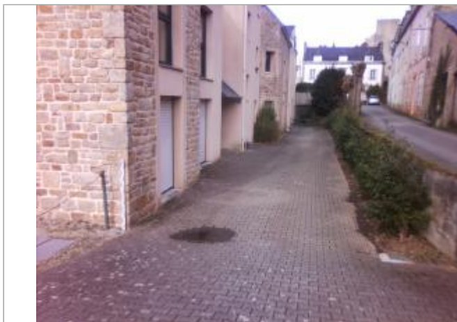
Vue d'ensemble de la façade du bâtiment d'habitation