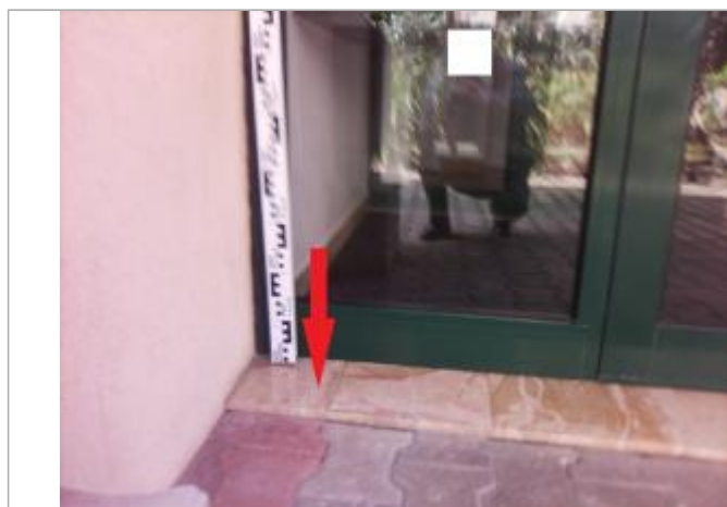
Seuil carrelé de la porte d'entrée du bâtiment

Altitude calculée de l'eau (en m) : 4.86 m