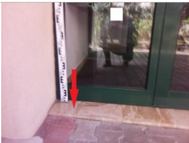
Seuil carrelé de la porte d'entrée du bâtiment

Altitude calculée de l'eau (en m) : 4.86