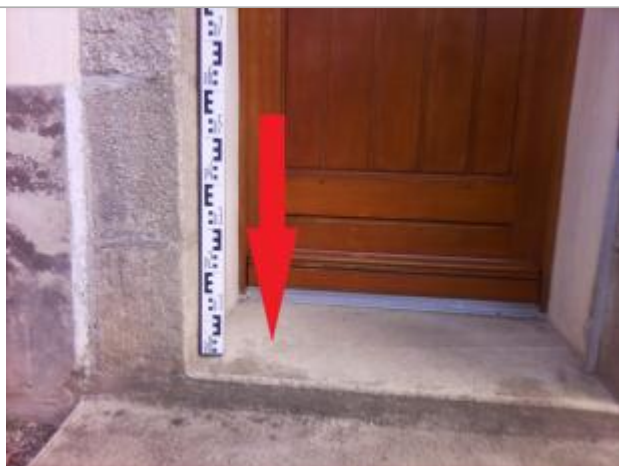
Seuil de la porte d'entrée de l'habitation

Altitude calculée de l'eau (en m) : 5.04 m