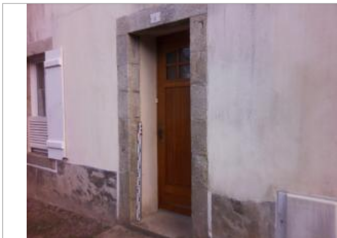
Porte d'entrée de l'habitation

Coordonnées WGS84 : X: -4.10627590 / Y: 47.99861050