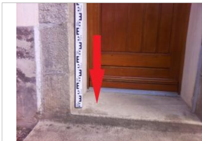
Seuil de la porte d'entrée de l'habitation

Altitude calculée de l'eau (en m) : 5.04