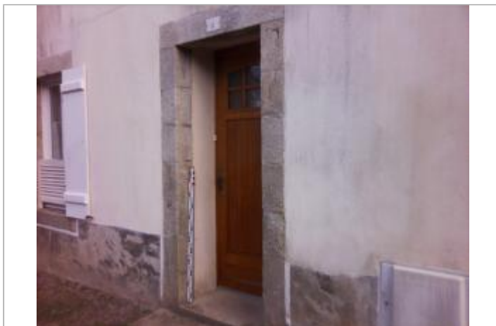
Porte d'entrée de l'habitation