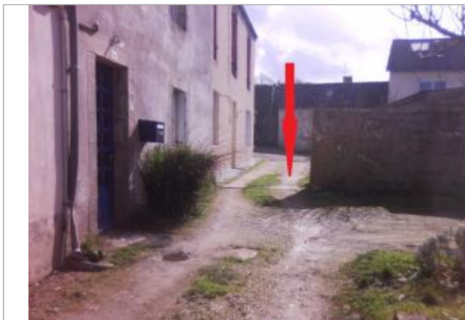
Vue d'ensemble de la façade du bâtiment d'habitation