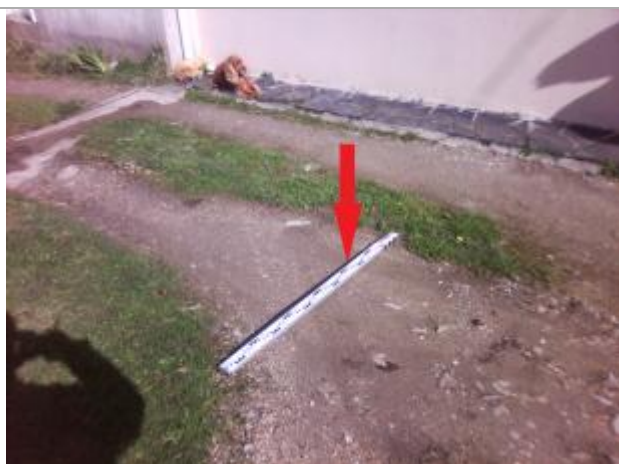
Sol à proximité de la porte d'entrée

Altitude calculée de l'eau (en m) : 5.09