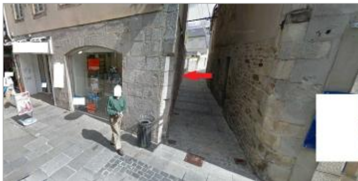
Vue sur la ruelle où se trouve l'arrière boutique