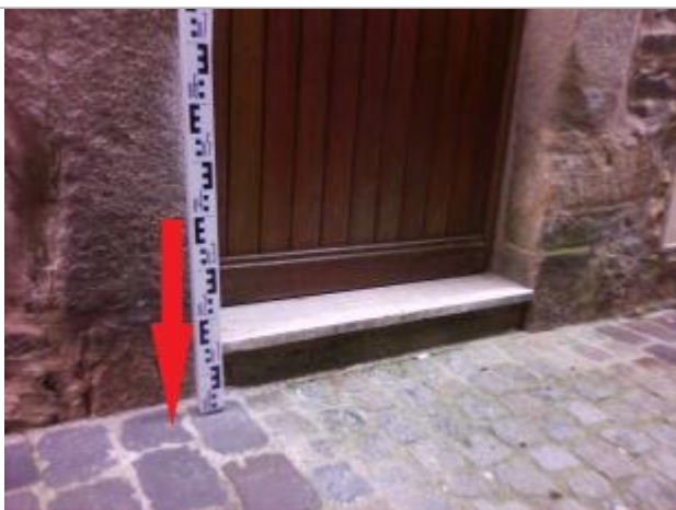
Sol venelle au droit du montant gauche de la porte du n° 2

Altitude calculée de l'eau (en m) : 4.68 m