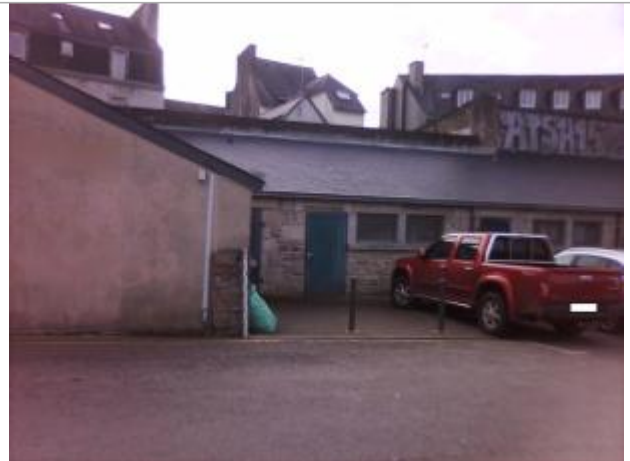
Parking de la glacière - côté librairie Ravy