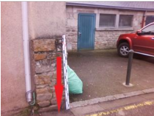
Vue d'ensemble du côté gauche du parking