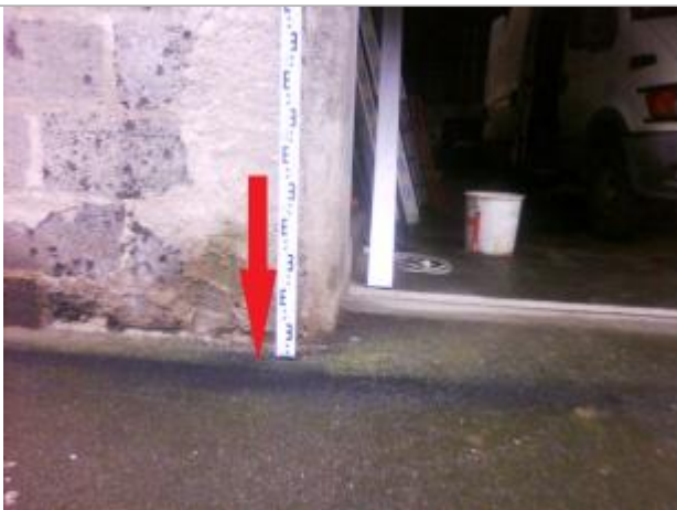
Sol du trottoir au droit du mur gauche de la porte de garage

Altitude calculée de l'eau (en m) : 5.67 m