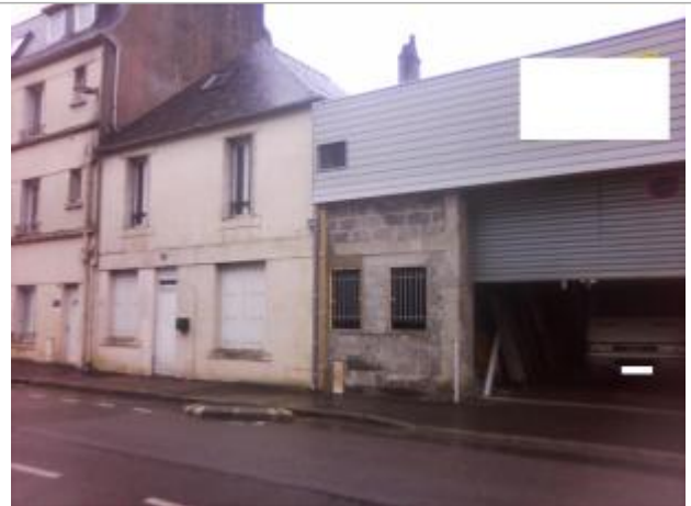
Vue d'ensemble de la devanture de la menuiserie