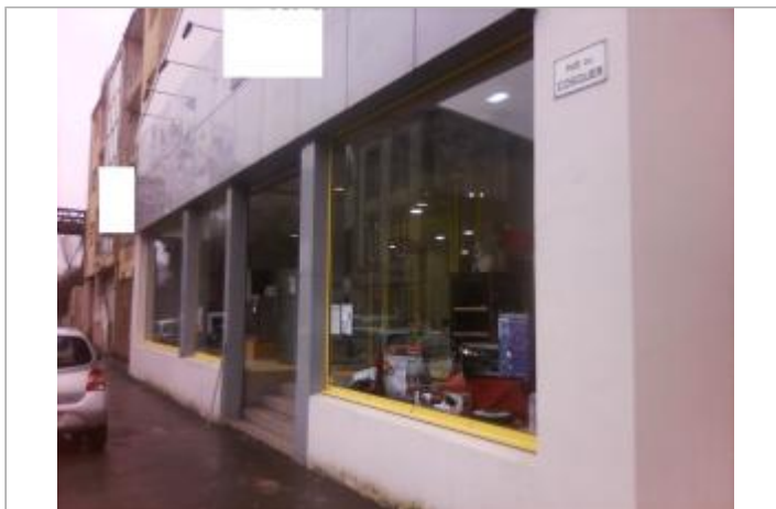
Devanture du bâtiment de commerce