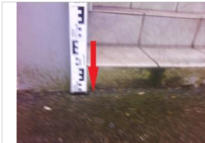
Sol du trottoir au pied de l'escalier

Altitude calculée de l'eau (en m) : 5.53