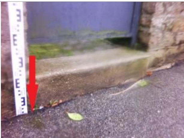
Sol du trottoir au droit du montant de la porte d'entrée du jardin

Altitude calculée de l'eau (en m) : 5.41 m