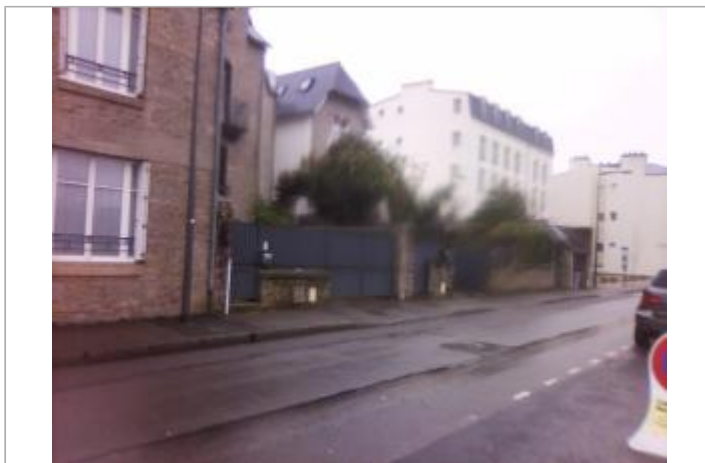
Vue d'ensemble 78, RUE DE PROVIDENCE