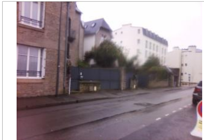
Vue d'ensemble 78, RUE DE PROVIDENCE

Coordonnées WGS84 : X: -4.10949230 / Y: 47.99979270