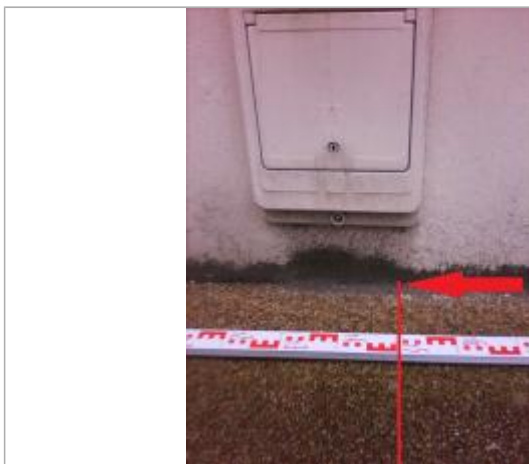
1,50m à partir de la limite droite du magasin sur le trottoir vers la rue du chapeau rouge

Altitude calculée de l'eau (en m) : 4.95