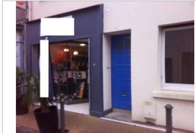
Vue d'ensemble de la devanture du magasin

Coordonnées WGS84 : X: -4.10729090 / Y: 47.99668760