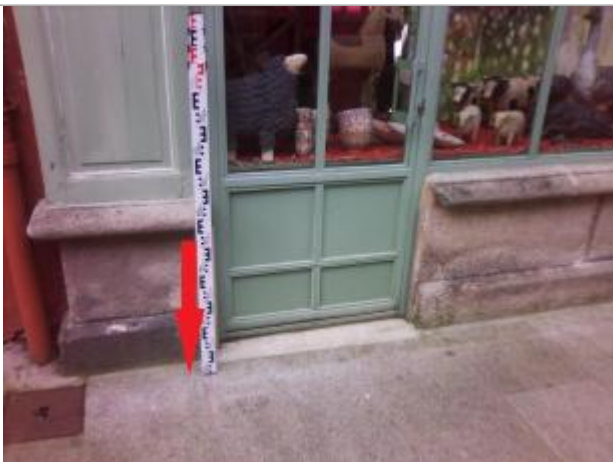
Sol, face au 16 rue Laennec le long du montant gauche de la porte

Altitude calculée de l'eau (en m) : 4.1 m