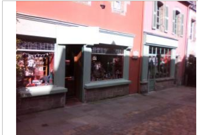
Devanture du bâtiment de commerce

Coordonnées WGS84 : X: -4.10696180 / Y: 47.99522120