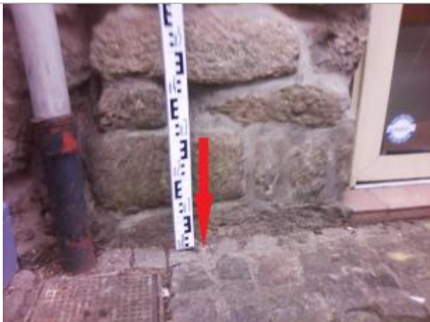
Chaussée entre la descente de gouttière et la porte vitrée

Altitude calculée de l'eau (en m) : 3.89 m