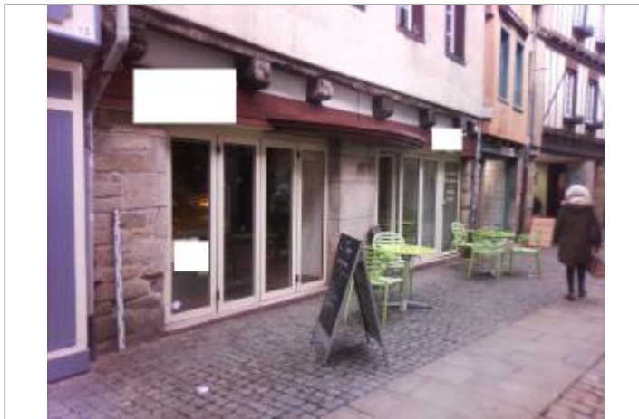
Devanture de la boulangerie