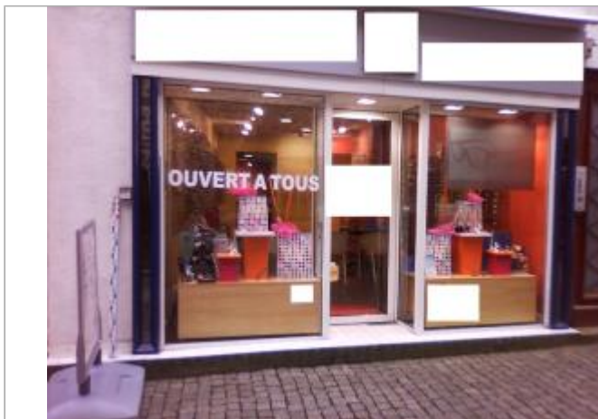
Devanture du bâtiment de commerce