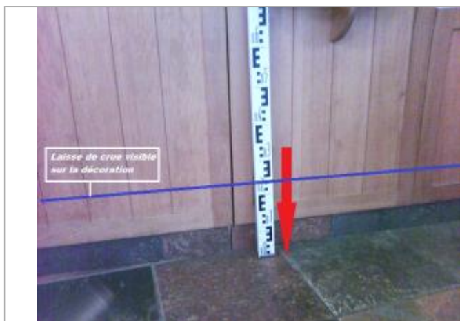
Sol du magasin - seuil d'entrée du magasin

Altitude calculée de l'eau (en m) : 3.99 m