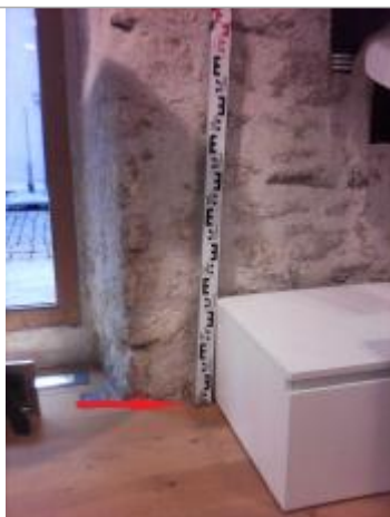
plancher à l'intérieur du magasin

Altitude calculée de l'eau (en m) : 4.09 m