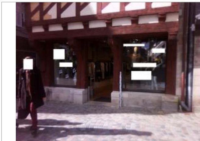
Devanture du bâtiment de commerce