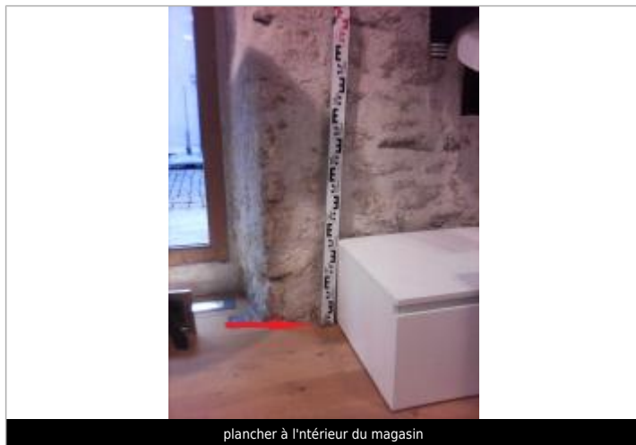
plancher à l'intérieur du magasin

Altitude calculée de l'eau (en m) : 4.09 m