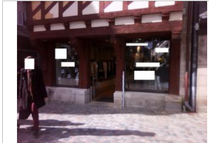
Devanture du bâtiment de commerce