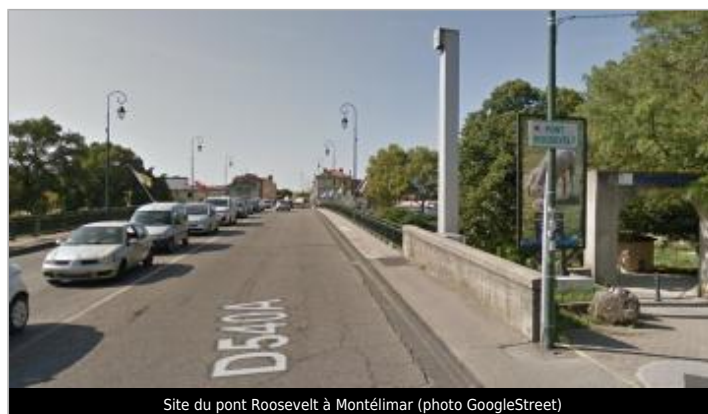
Site du pont Roosevelt à Montélimar

GÉOLOCALISATION Coordonnées WGS84 : X: 4.74812830 / Y: 44.55219500 Coordonnées RGF93 (Lambert 93) X: 838841.23 / Y: 6385216.92 Coordonnées RGF93 (ETRS89) : X: 4.7481283 / Y: 44.552195 Code Hydro: V44-0400 Rive de référence: