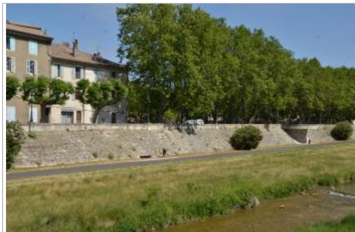
Vue générale du site, les repères sont sur le parement de la digue.