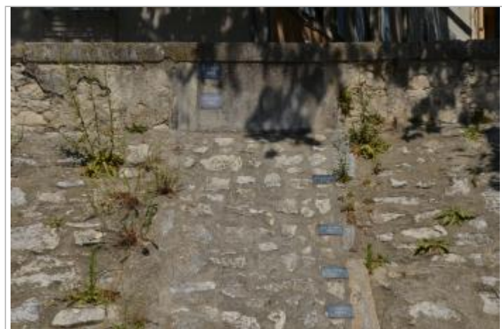
6 repères sur la digue côté rivière