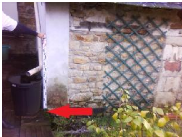
Coin gauche du garage en regardant le bâtiment

Altitude calculée de l'eau (en m) : 4.44