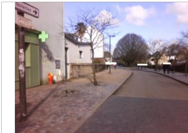
Vue d'ensemble de la rue devant la pharmacie