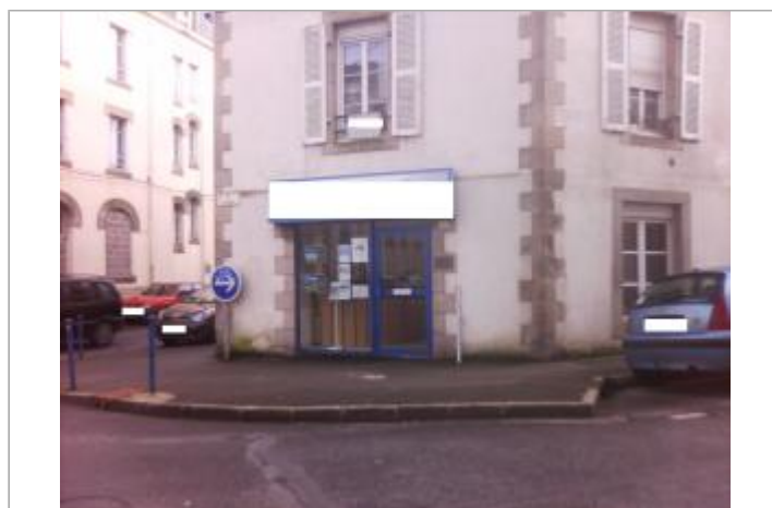
Vue d'ensemble de la devanture du bâtiment privé

GÉOLOCALISATION Coordonnées WGS84 : X: -4.10841130 / Y: 47.99828140 Coordonnées RGF93 (Lambert 93) : X: 170556.2 / Y: 6790279.79 Coordonnées RGF93 (ETRS89) : X: -4.1084113 / Y: 47.9982814 Code Hydro: J43-0300 Rive de référence: Droite