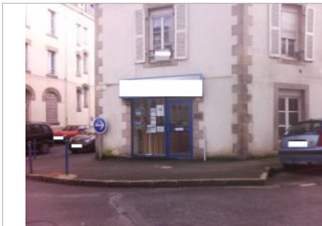
Vue d'ensemble de la devanture du bâtiment privé