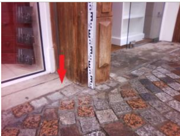
Seuil extérieur du magasin

Altitude calculée de l'eau (en m) : 3.99