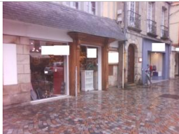
Vue d'ensemble devanture du commerce 4, PLACE TERRE AU DUC