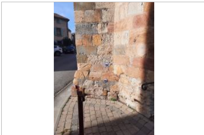
vue de l'église avec les différents repères