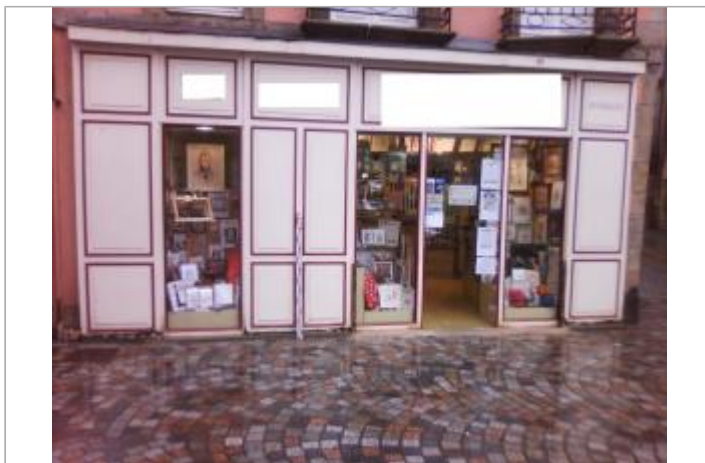
Vue d'ensemble de la devanture du bâtiment de commerce