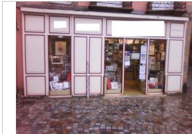
Vue d'ensemble de la devanture du bâtiment de commerce