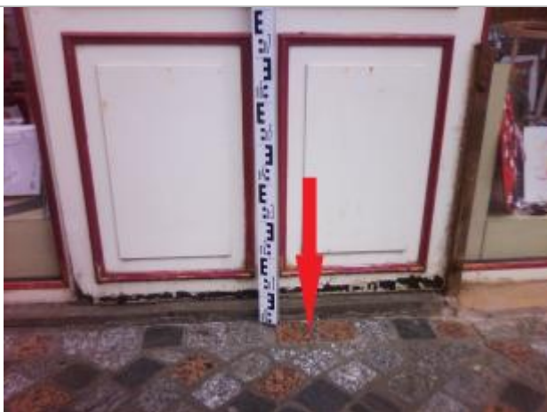
Seuil de la porte du magasin

Altitude calculée de l'eau (en m) : 3.97