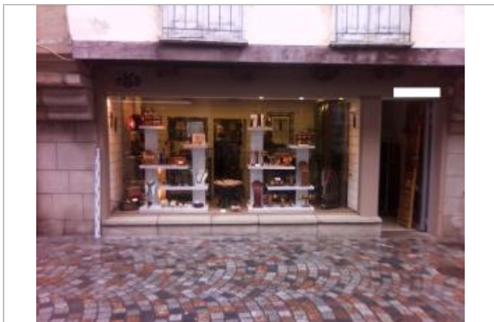
Vue d'ensemble de la devanture du bâtiment de commerce