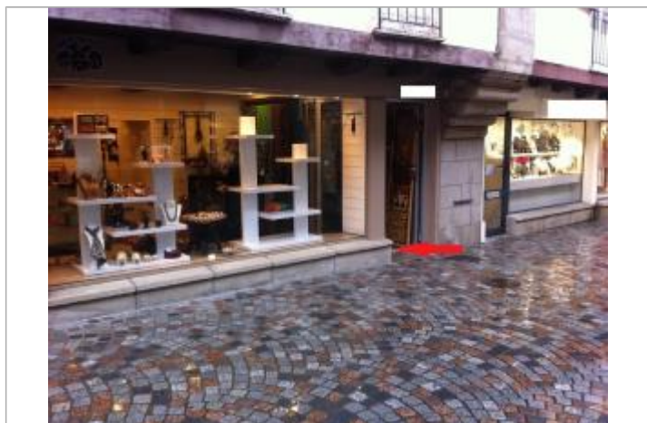
Vue d'ensemble de la devanture du bâtiment de commerce

Maximum de l'inondation : Non renseigné Visibilité : Non État du repère : Moyen Pérennité : Aucune Repère calculé : Non PHEC : Oui