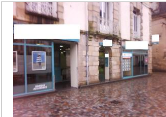
Vue d'ensemble de la devanture de l'agence bancaire