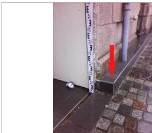
Margelle le long de la devanture de l'agence