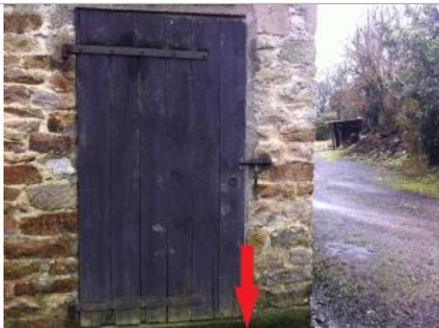
Sol devant la porte

Altitude calculée de l'eau (en m) : 9.82 m