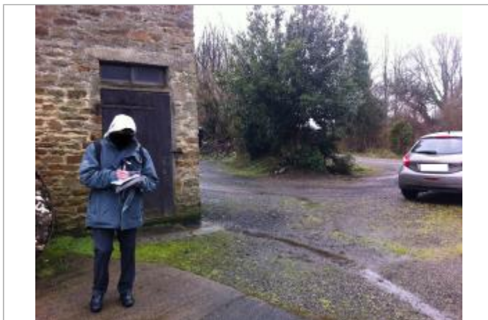
Vue d'ensemble de la façade du bâtiment