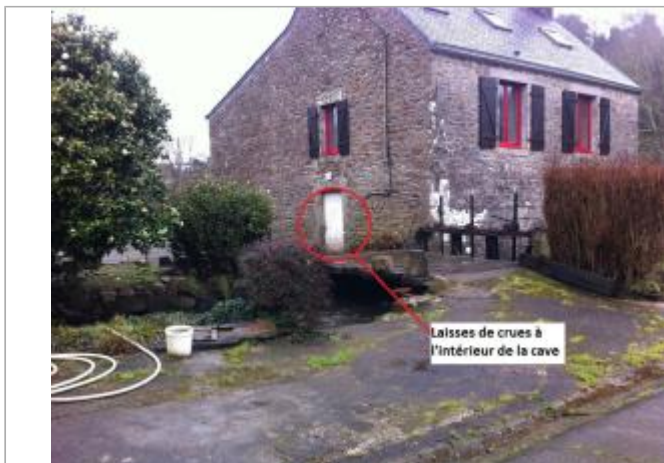
Vue d'ensemble du bâtiment d'habitation , 19 , allée du Moulin Saint Denis