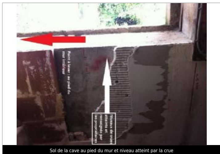
Sol de la cave au pied du mur et niveau atteint par la crue

Altitude calculée de l'eau (en m) : 9.29 m