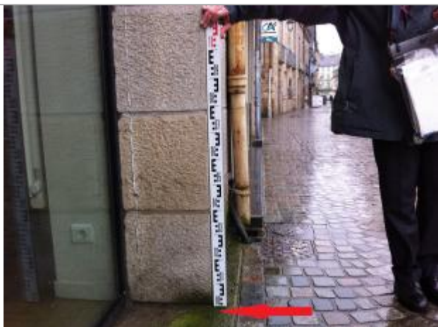
Sol de la chaussée devant la vitrine - côté droit de la devanture

Type de repérage : Campagne de terrain post-inondation