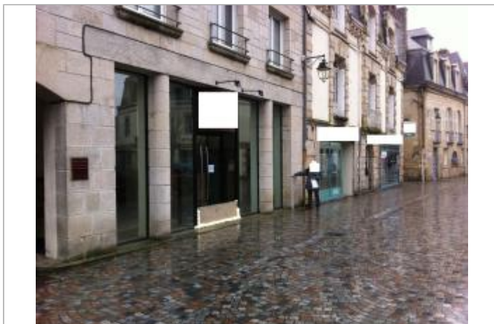
Vue d'ensemble rue René Madec