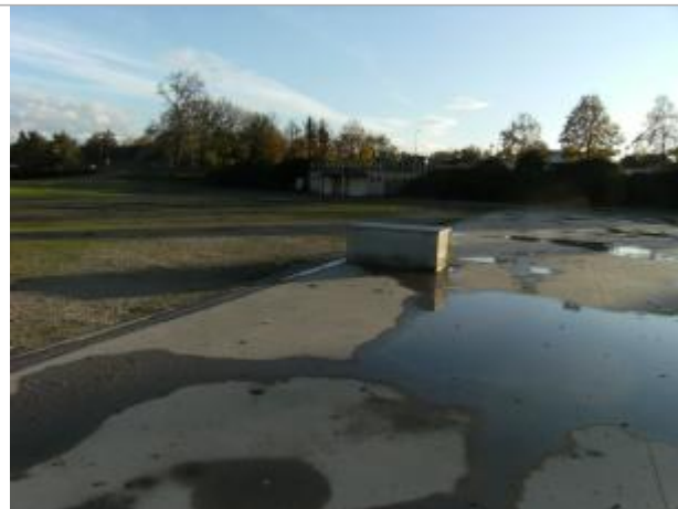
Site et repère de la crue de novembre 2014