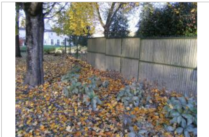
Site et repère de la crue de novembre 2014