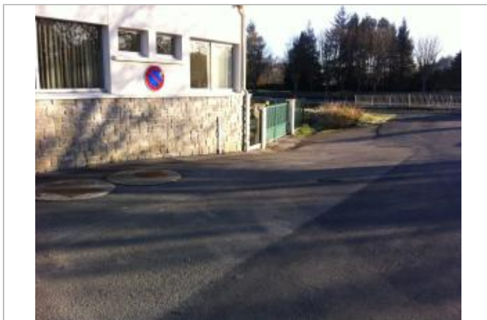
Station AEP Toulboubou