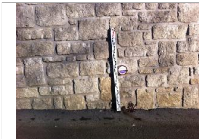
Bâtiment principal station AEP_cruce 08 02 2014 avec macaron de janvier 1995 (PHEC)