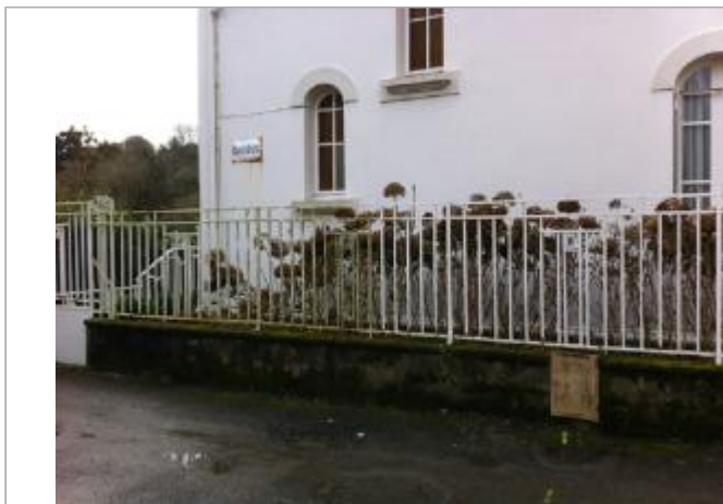
Vue d'ensemble de la facade du bâtiment d'habitation côté rue