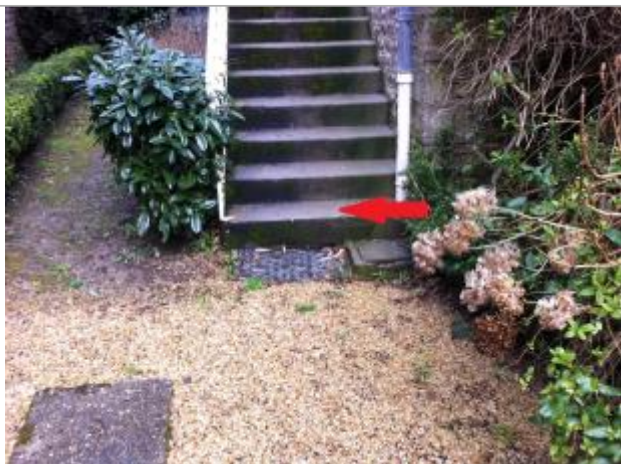
1ère marche de l'escalier depuis le bas ( côté jardin )