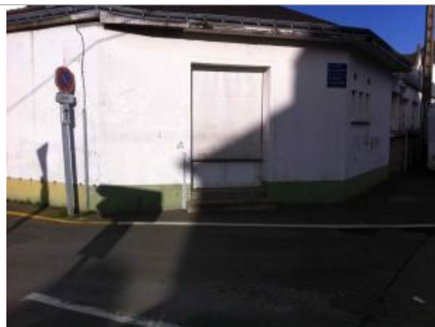
Bâtiment détruit de l'ancien hôpital