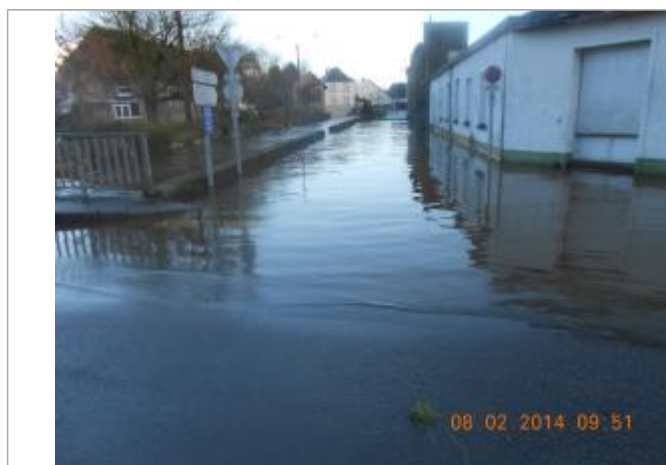
Photo prise environ 2 heures en décrue

Différence entre le niveau d'eau et la référence (en m) : 0.300 m