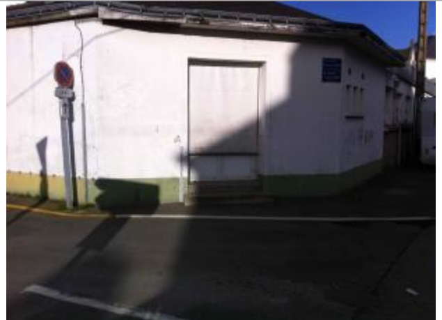
Bâtiment détruit de l'ancien hôpital

Coordonnées WGS84 : X: -2.96854280 / Y: 48.06980800