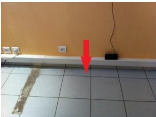
Plancher du bâtiment / bureau

Altitude calculée de l'eau (en m) : 6.41