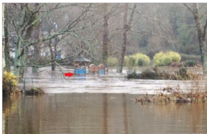
Sol droit du jeu d'enfant

Altitude calculée de l'eau (en m) : 5.8 m