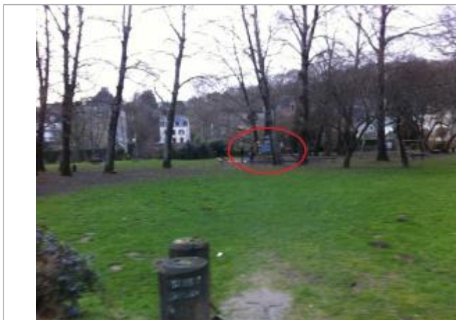
Aire de jeux des Gorets