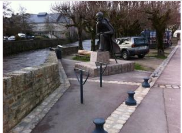
Vue d'ensemble banc publique de la place Lovignon

Coordonnées WGS84 : X: -3.54335060 / Y: 47.87289300