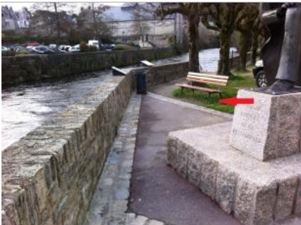
Sol au droit du banc

Altitude calculée de l'eau (en m) : 5.38 m