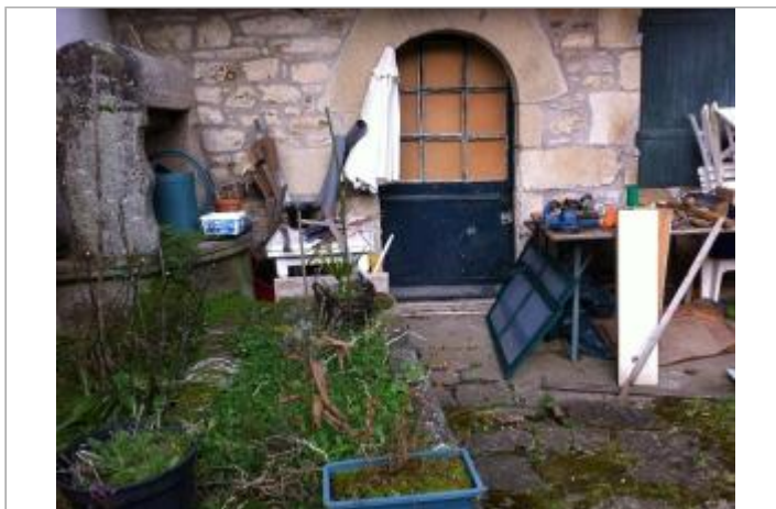
Cave de bâtiment d'habitation