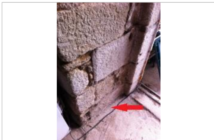
Sol de la cave au droit du mur

Altitude calculée de l'eau (en m) : 5.01 m