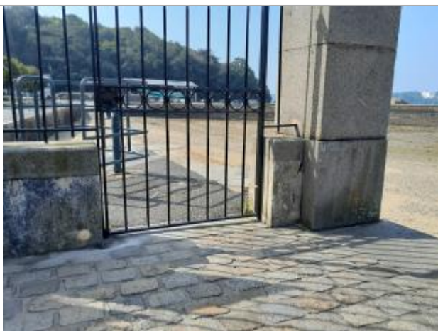
Repère de submersion installé en aout 2024

Type de repérage : Campagne de terrain post-inondation