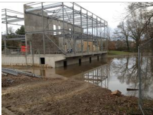
Maison de l'Enfance 24/12/2013