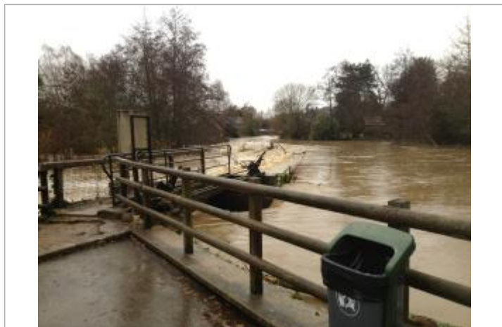
Moulin des Planches 24/12/2013