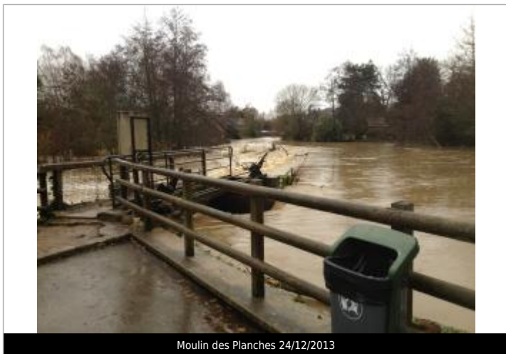
Moulin des Planches 24/12/2013