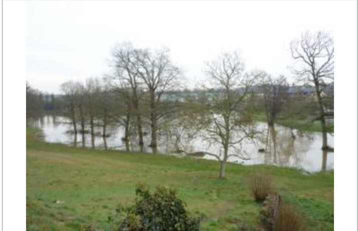
Etang de la Cane 01/03/2010

MARQUE Texte : Etang de la Cane 01/03/2010 Maximum de l'inondation : Non