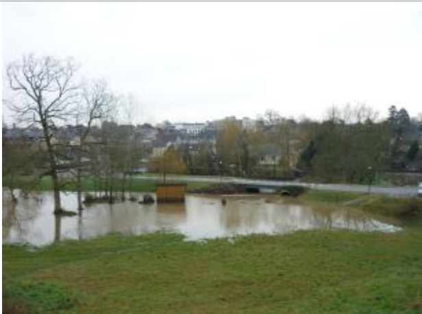
Etang de la Cane 01/03/2010