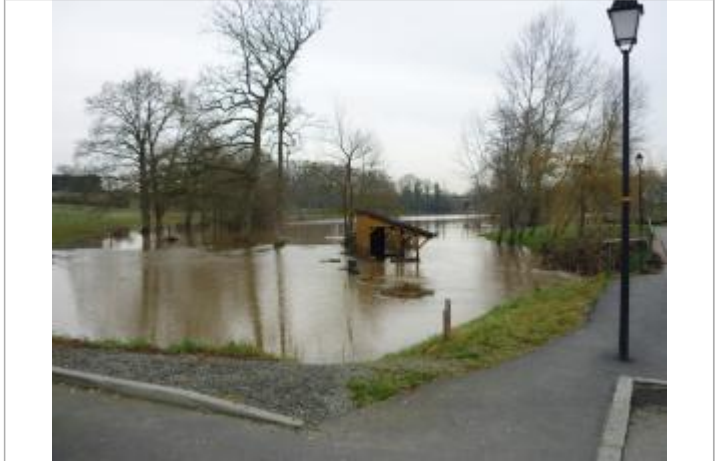
Etang de la Cane 01/03/2010