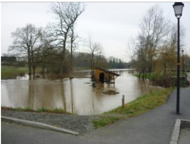
Etang de la Cane 01/03/2010