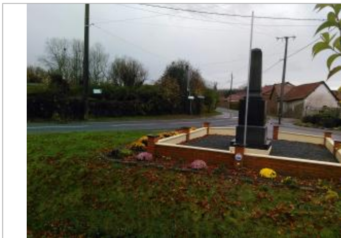
Muret du Monument aux morts de Teneur