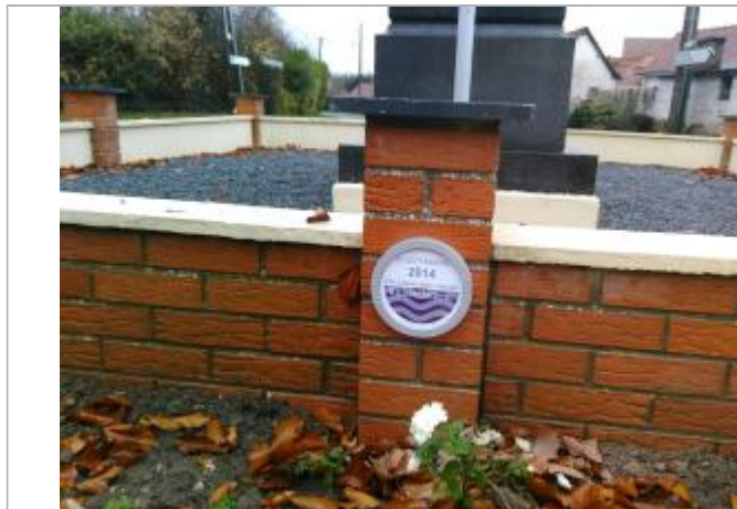
Repère posé sur le muret du Monument aux morts, à l'extérieur, coté rue d'Heuchin